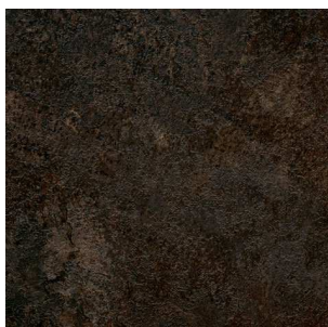
S 611 Элинор