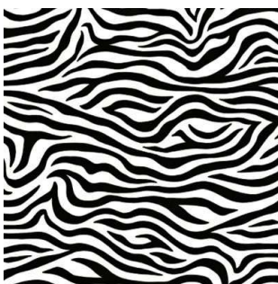
L 985 Сафари