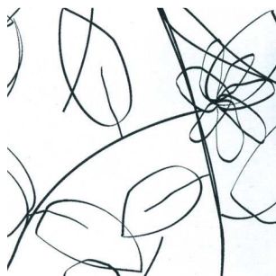
L 417 Амели