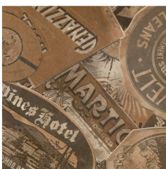
L 988 Вестерн