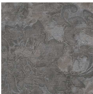
S 613 Прованс